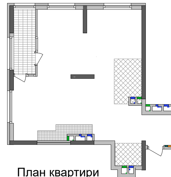
План квартири без перегородок