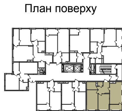
План квартири без перегородок