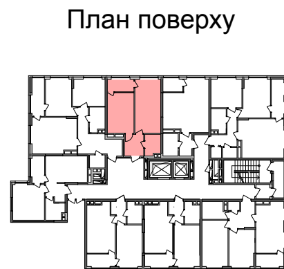
План квартири без перегородок